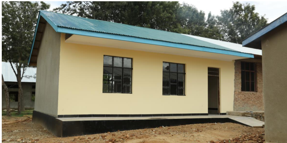
Picha Na. 03: Ujenzi wa madarasa 3 na Ofisi 1 Shule ya Sekondari Mawelewele