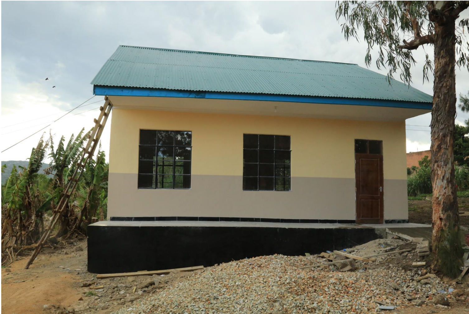
Picha Na. 06: Ujenzi wa darasa 1 Shule ya Sekondari Miyomboni