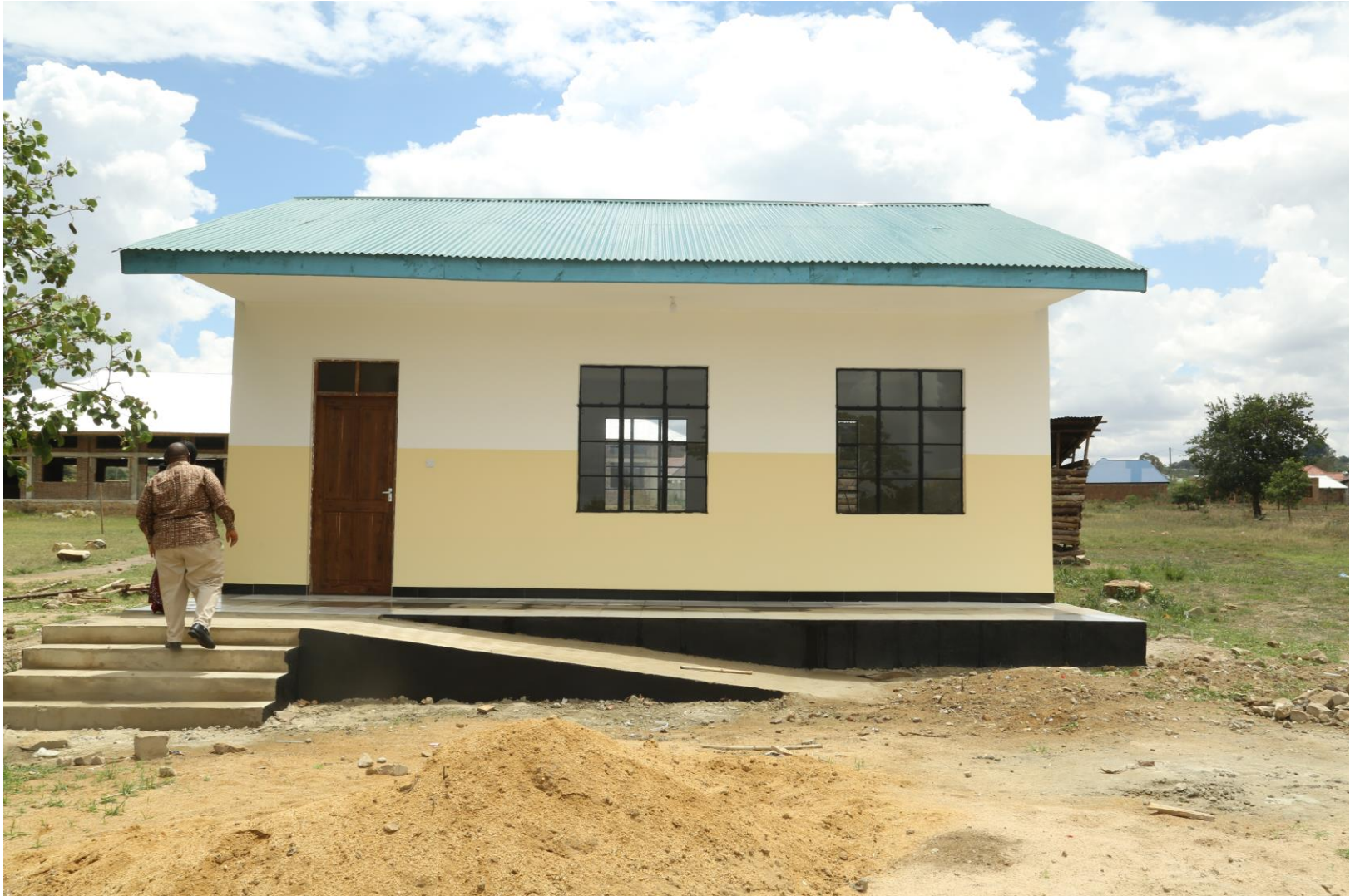
Picha Na.12: Ujenzi wa Darasa 1 Shule ya Sekondari Kwakilosa