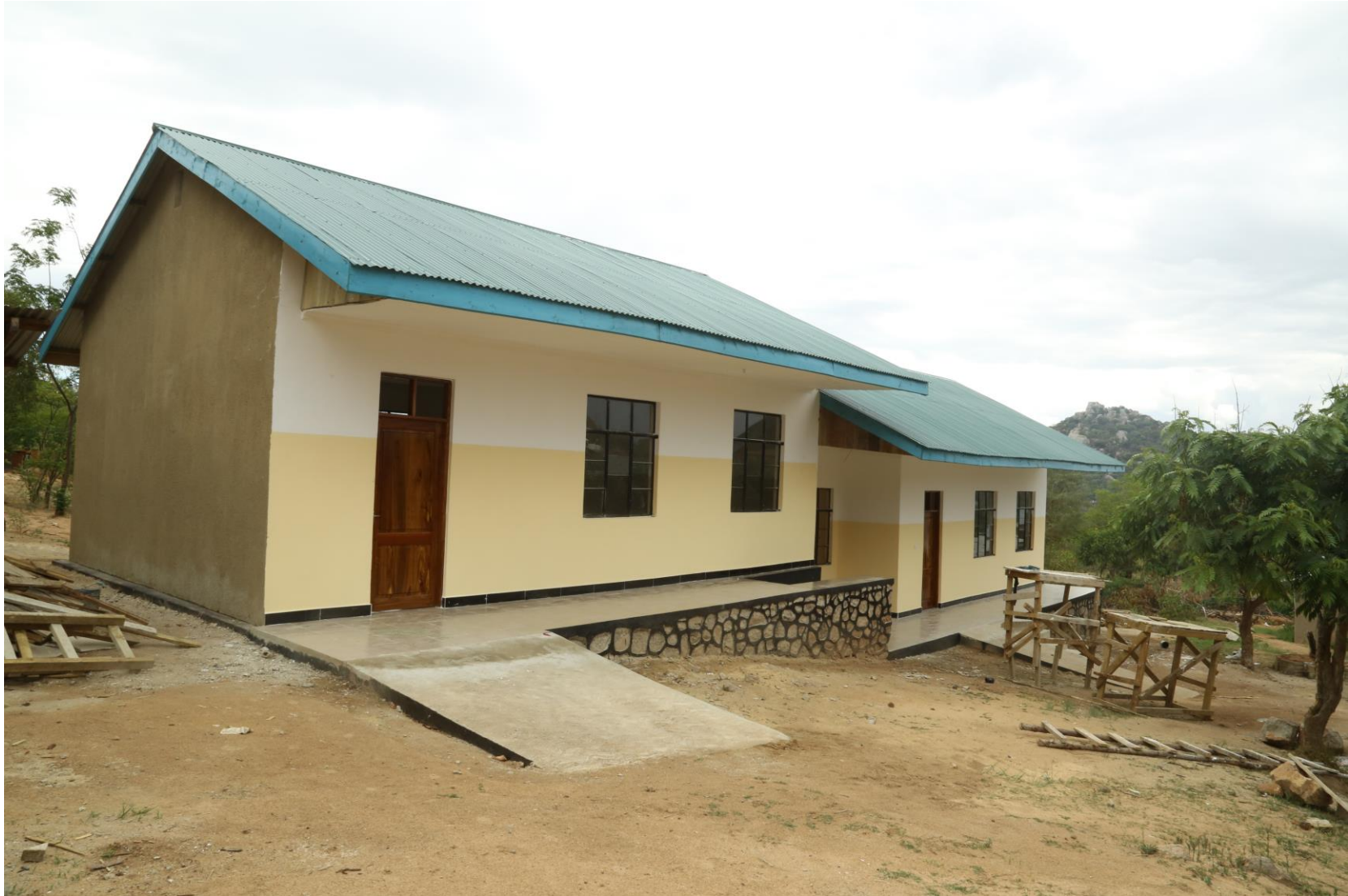
Picha Na. 16: Ujenzi wa madarasa 2 na Ofisi 1 Shule ya Sekondari Mtwivila