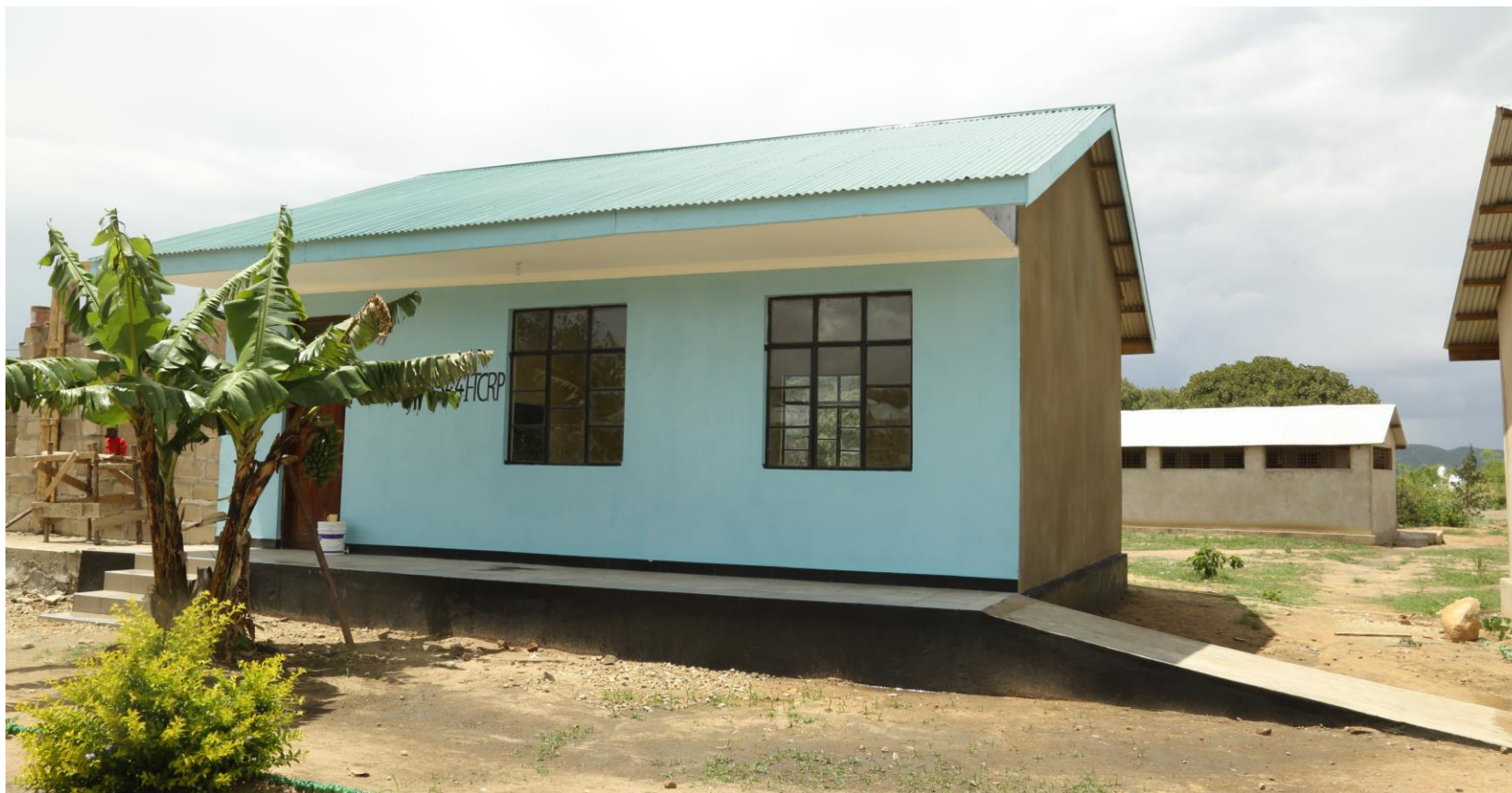
Picha Na. 07: Ujenzi wa darasa 1 Sekondari ya Mivinjeni Idunda