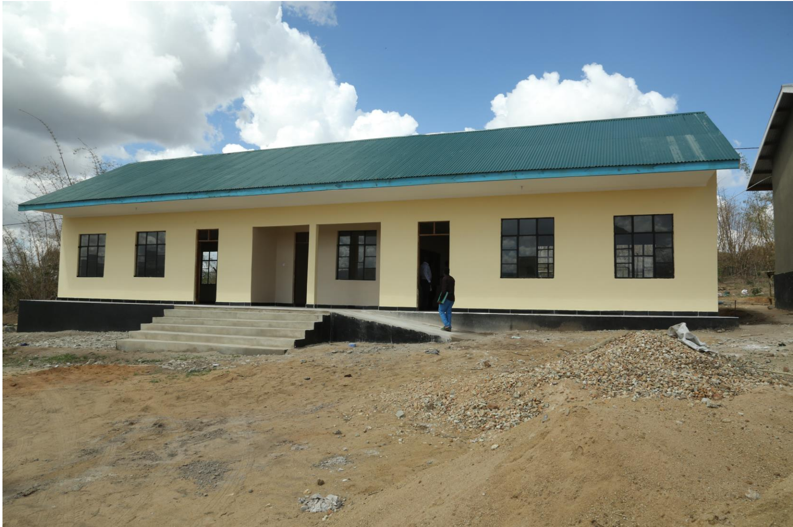
Picha Na.14: Ujenzi wa Madarasa 2 na Ofisi 1 Shule ya Sekondari Kigungawe