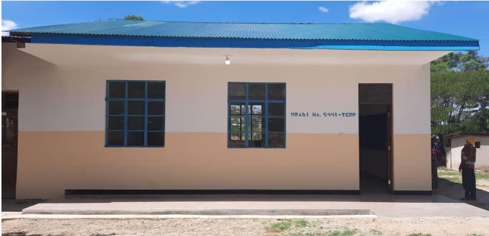
Picha Na. 02: Ujenzi wa darasa 1 shule ya sekondari Mlamke