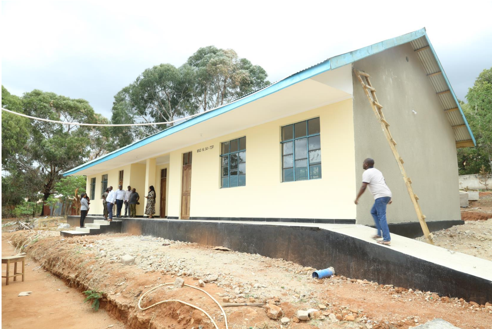
Picha Na.4: Ujenzi wa madarasa 2 na Ofisi 1 Shule ya Sekondari Lugalo