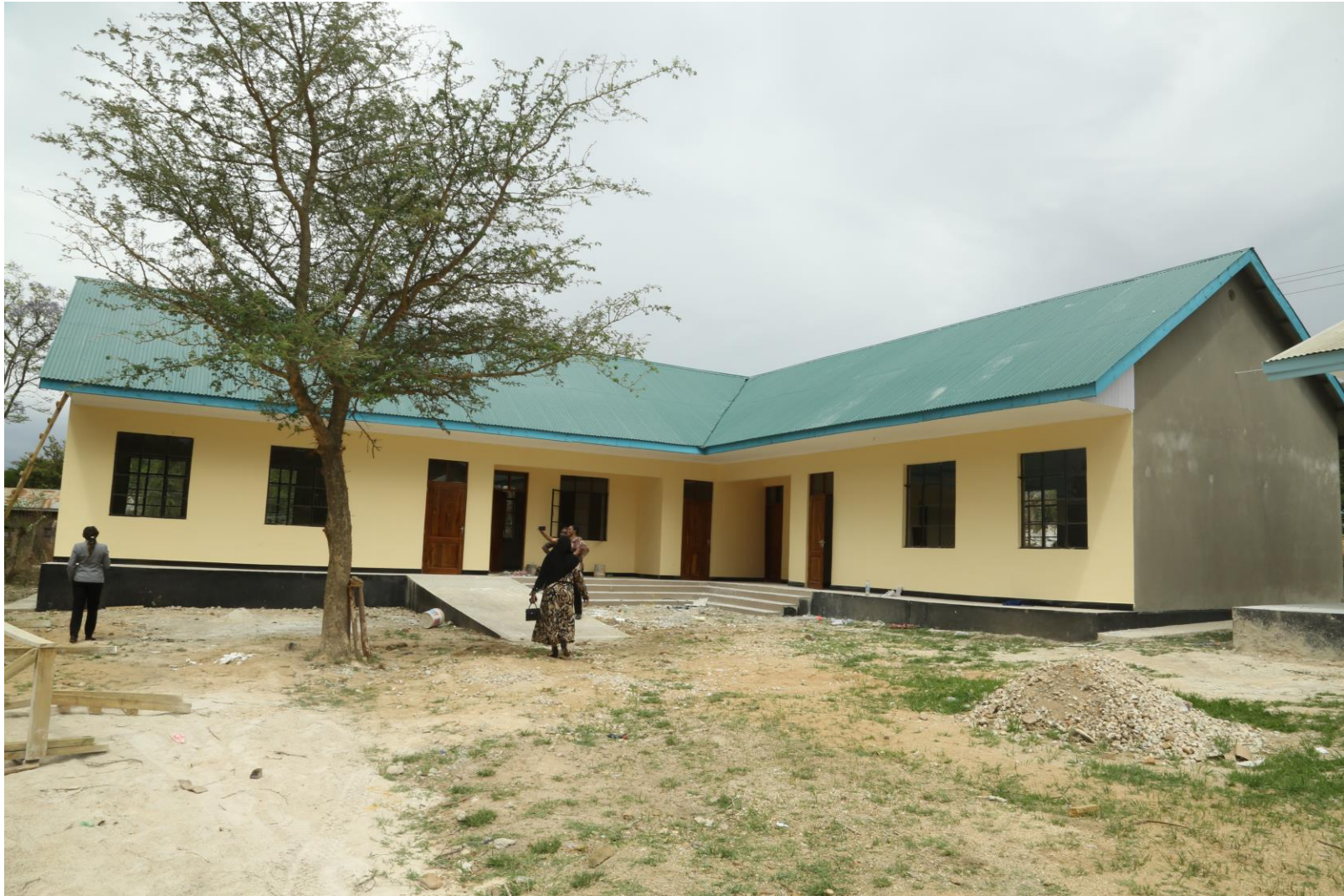
Picha Na. 13: Ujenzi wa madarasa 3 na Ofisi 1 Shule ya Sekondari Kleruu