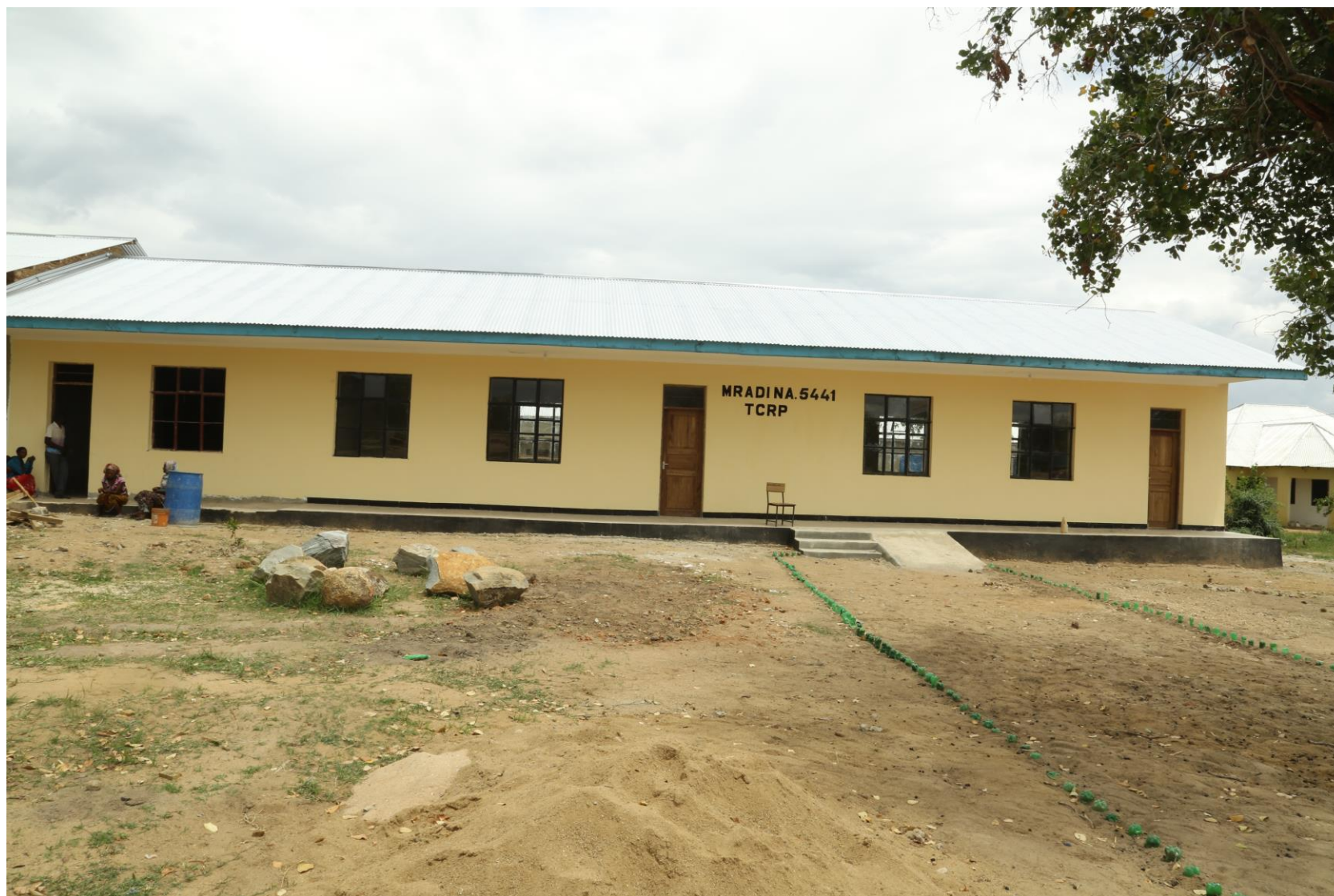
Picha Na.5: Ujenzi wa madarasa 2 na Ofisi 1 Shule ya Sekondari Mlandege