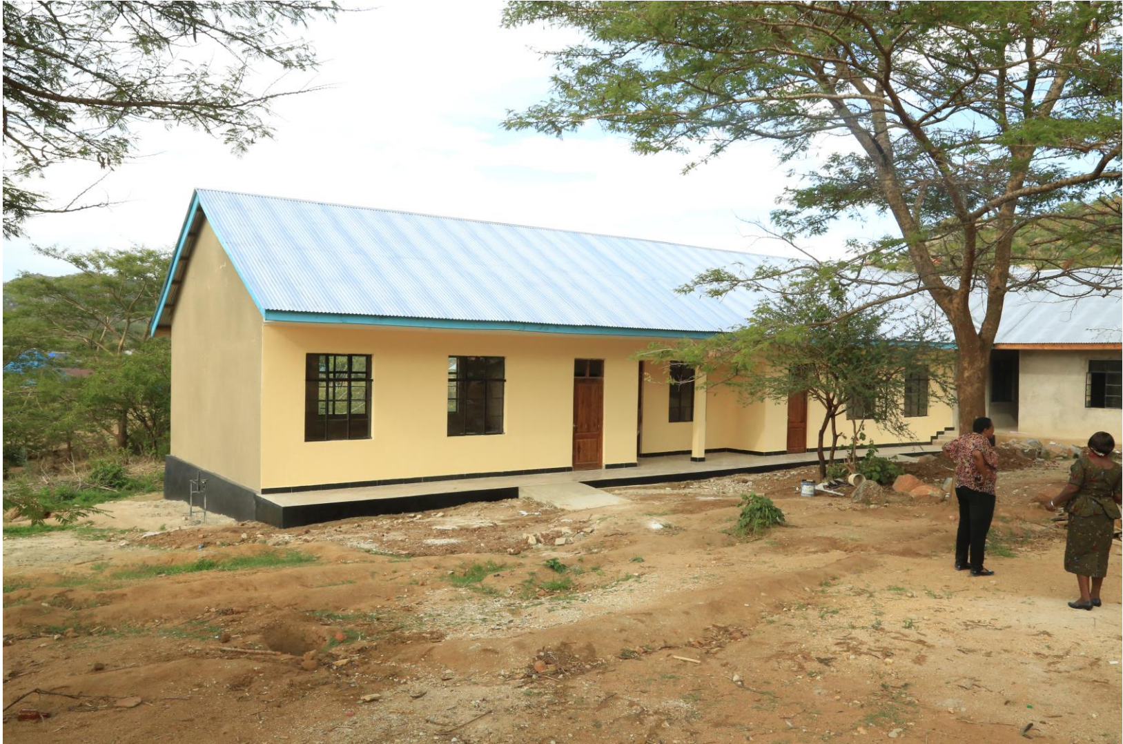
Picha Na. 15: Ujenzi wa madarasa 2 shule ya skondari Kihesa