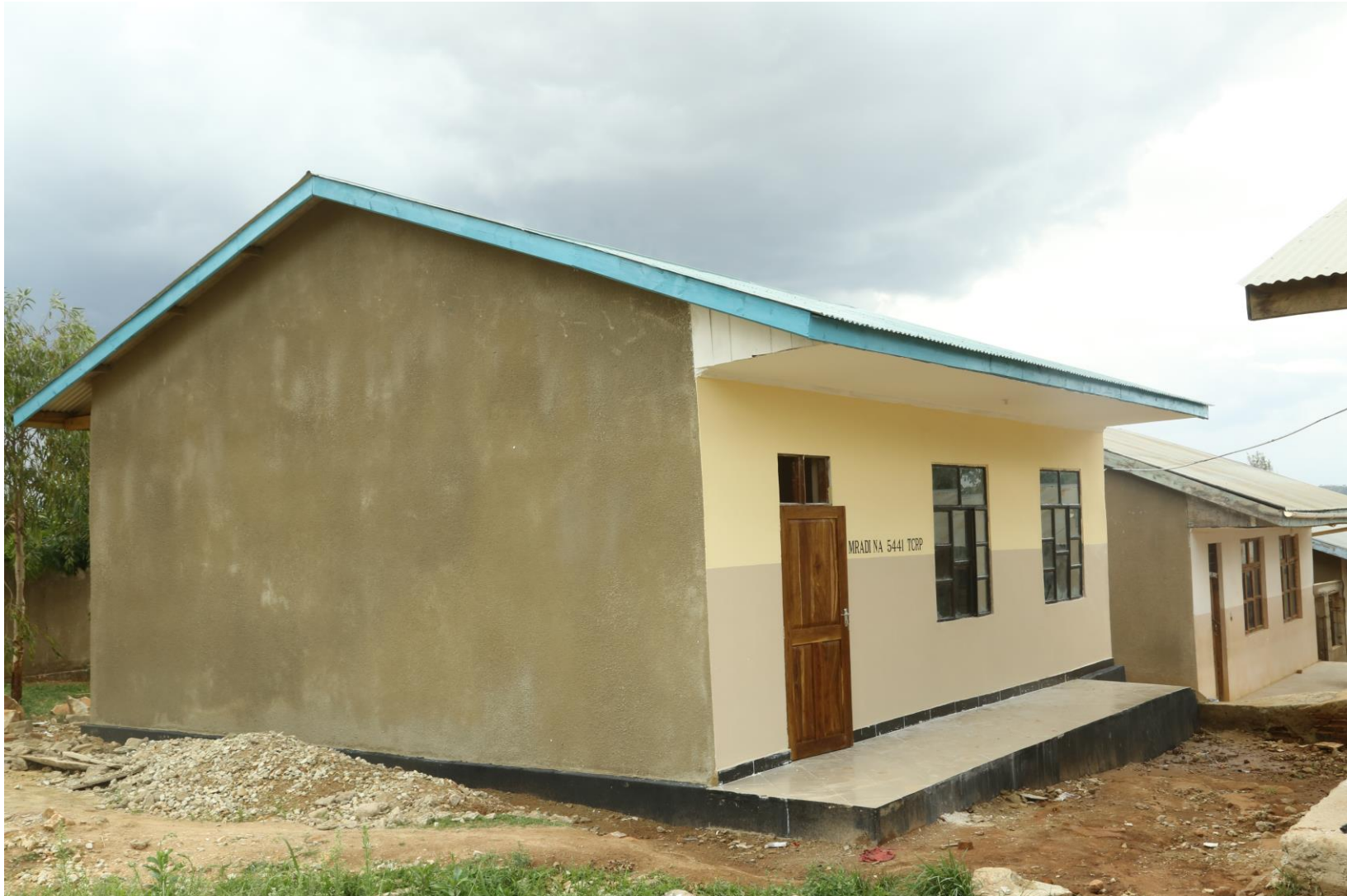
Picha Na.09: Ujenzi wa Darasa 1 shule ya sekondari Mkwawa