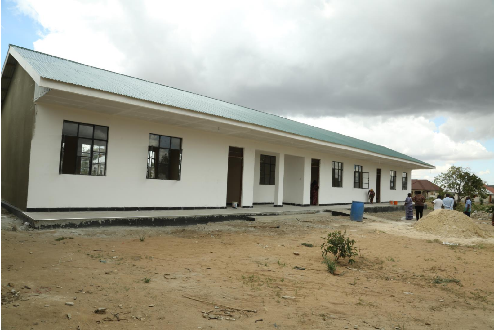
Picha Na. 10: Ujenzi wa Madarasa 3 na Ofisi 1 shule ya sekondari Ipogoro