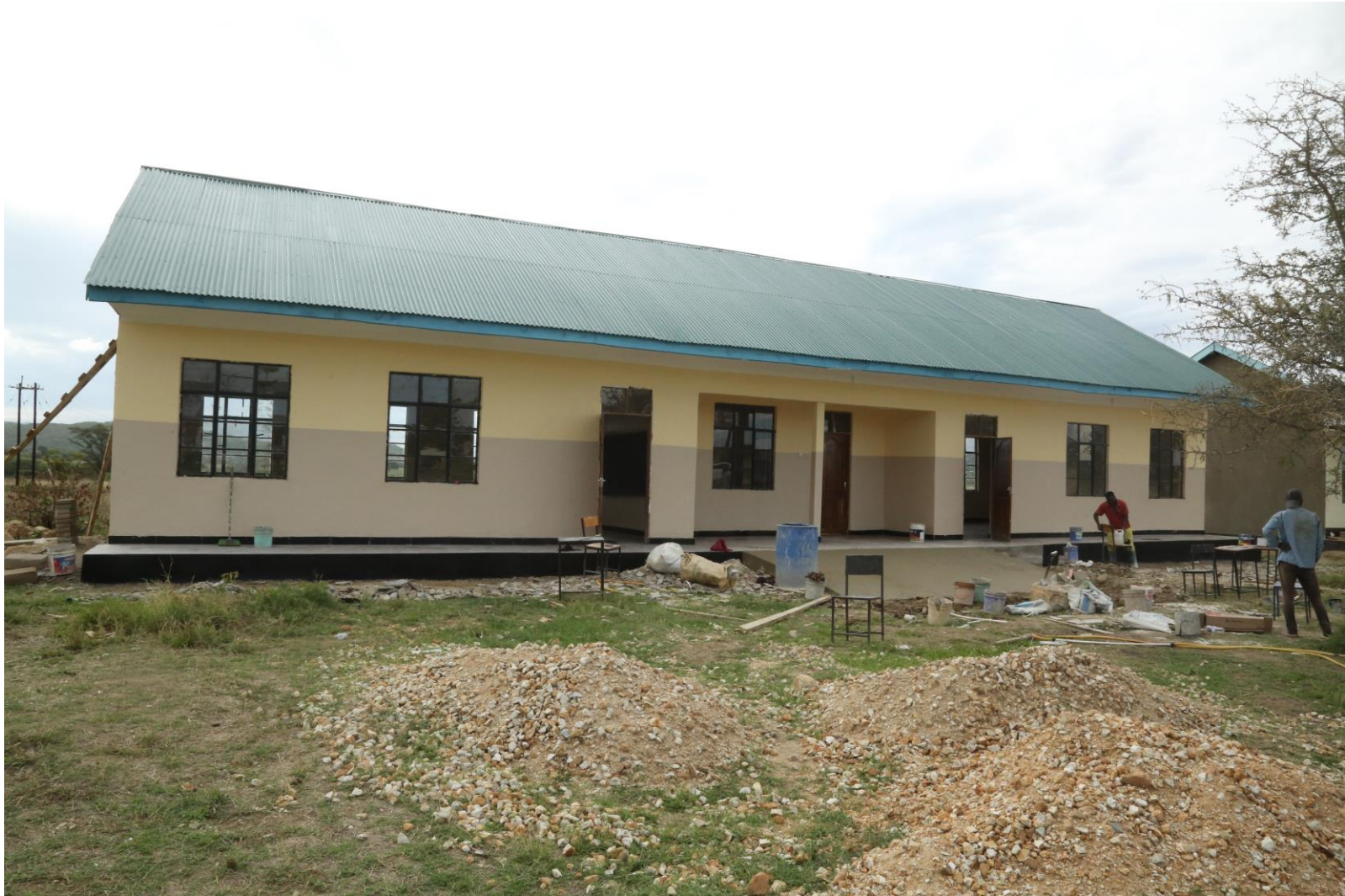
Picha Na.11: Ujenzi wa Madarasa 2 na Ofisi 1 Sekondari ya Nduli