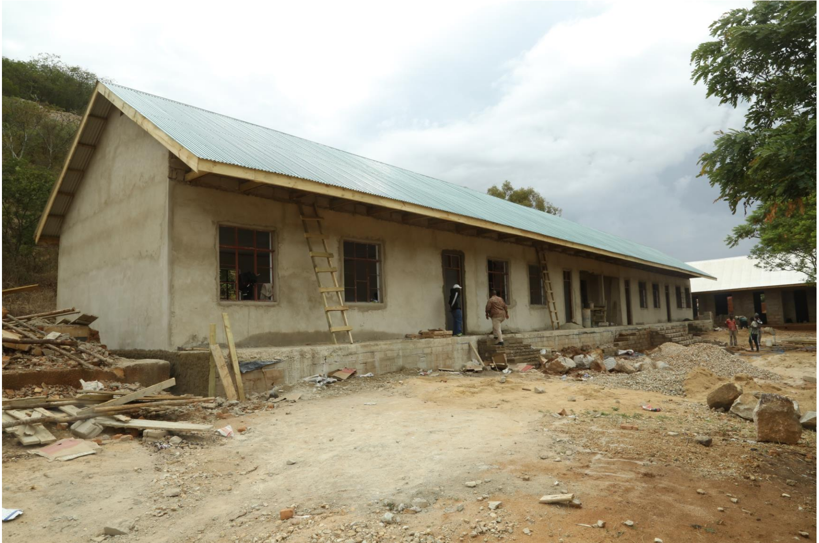
Picha Na. 17: Ujenzi wa madarasa 4 na Ofisi 1 Shule ya Sekondari Umoja/Mtwivila"