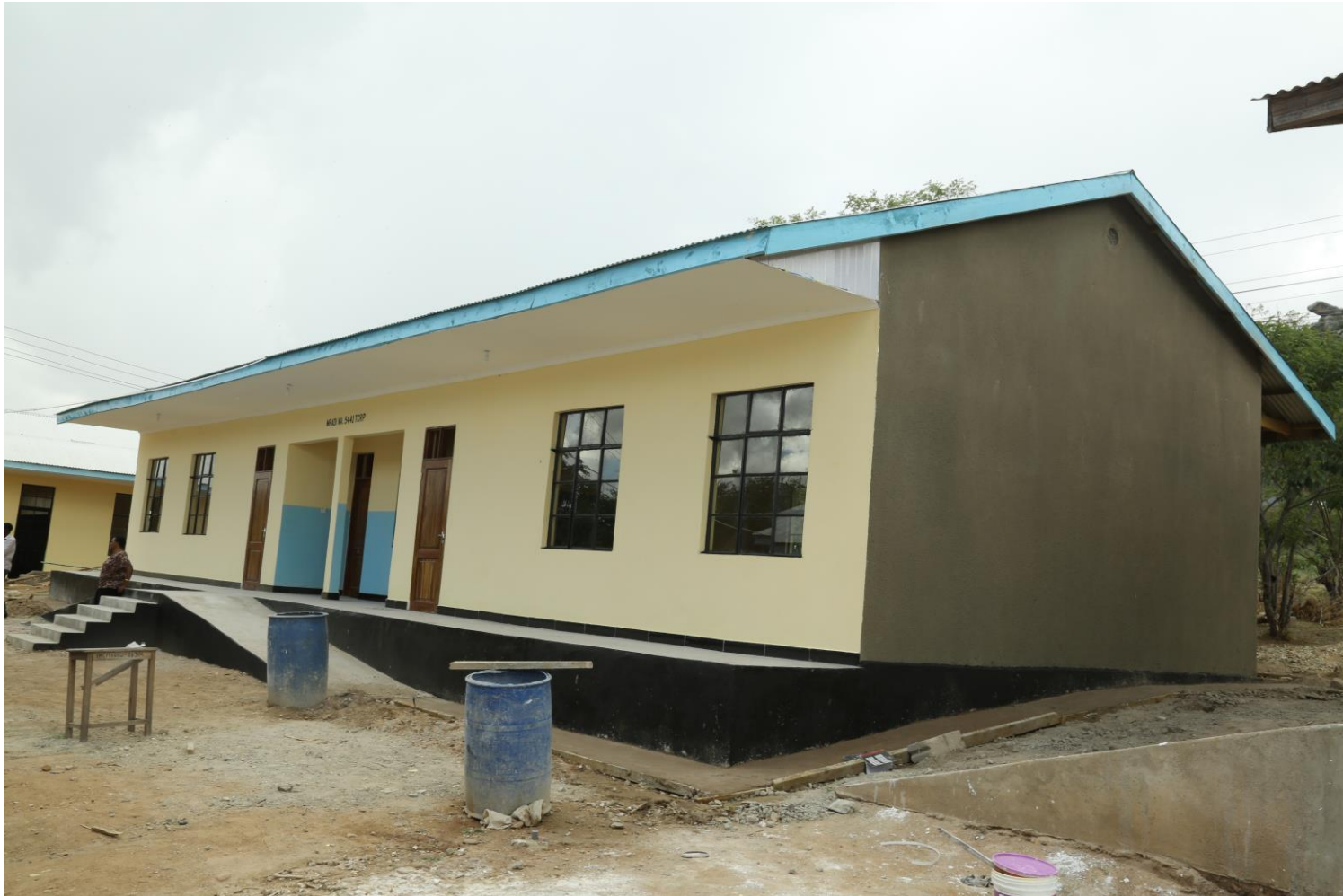
Picha Na. 08: Ujenzi wa madarasa 2 Shule ya Sekondari Tagamenda