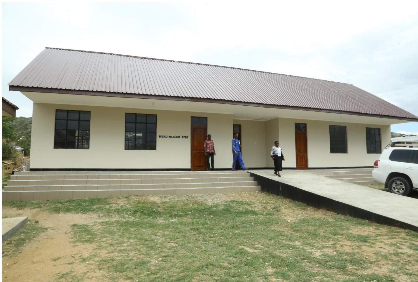
Picha Na.01: Ujenzi wa madarasa 2 na Ofisi 1 Sekondari ya wasichana Iringa